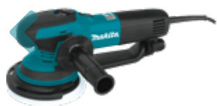
BO6050J Lijadora de 6" con Órbita Aleatoria