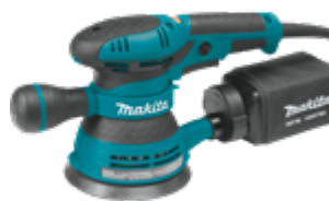
BO5041K Lijadora de 5" con Órbita Aleatoria