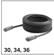
30, 34, 36